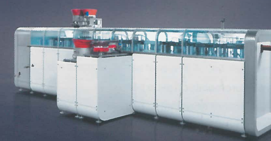
Genesis Автоматизация сборки Электронных сигарет